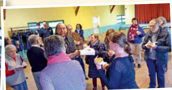
Bol de riz