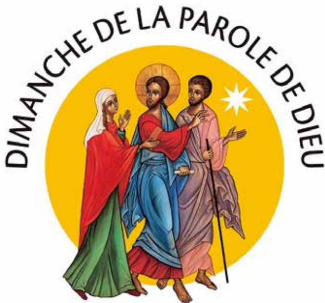
Le logo du SNPLS (Service national de la pastorale liturgique et sacramentelle)-ECF.