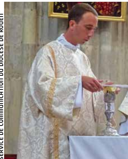
SERVICE DE COMMUNICATION DU DIOCÈSE DE ROUEN

Du latin cappa : « capuchon », « manteau à capuchon », « cape ». La chape provient d'un manteau de voyage porté dans l'Antiquité, la paenula , qui servait à protéger de la pluie. Aujourd'hui, long manteau de cérémonie drapant tout le corps constitué par une pièce d'étoffe de forme semi-circulaire ; la chape est maintenue sur le devant par des agrafes, elle est utilisée en dehors de la messe par l'officiant lors des processions, bénédictions solennelles, laudes ou vêpres. Mise à plat, elle forme un demi-cercle.