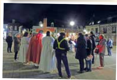
Lundi de Pâques