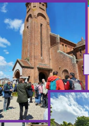
Marche des Vocations