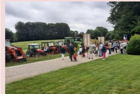
Abbe Olivier Meaume

Comptant sur votre présence pour en parler à ceux qui seront là lors d'échanges informels, à la sortie de la messe ou lors de la bénédiction des engins et pendant le verre de l'amitié qui suivra et auxquels vous êtes cordialement invités.